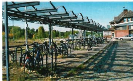
Risiko Fahrradständer: Allzu oft finden Bahnkunden ihr abgestelltes Fahrrad beschädigt oder gar nicht mehr vor. Ein besonderes Risiko gehen die Radfahrer ein, die gezwungen sind, ihr Fahrrad über Nacht am Bahnhof stehen zu lassen.

Während sich glücklicherweise wieder ein sehr stark frequentierter Fahrkartenschalter im Bahnhof befindet, wurde unsere Forderung nach Öffnung der WC-Anlagen von der Bundesbahnverwaltung neuerlich abschlägig beschieden.