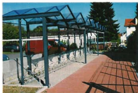
Gut gedacht, aber wenig frequentiert sind die Fahrradständer im hinteren Teil der Parkplätze. Sie bieten zwar ein Dach über dem Lenker, aber keine Möglichkeit, den Rahmen des Rades anzuschließen. Fahrradboxen könnten für eine höhere Sicherheit sorgen.